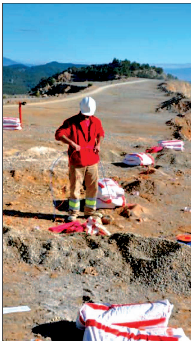
Imagen 6. Carga de barrenos.

De este cronograma se desprende la importancia dada a la fase de diseño del sistema, puesto que lo que se hizo, básicamente, explicar de forma detallada y exhaustiva el procedimiento de gestión del explosivo a los ingenieros de desarrollo de software. Durante esta etapa de diseño, se estudió en gabinete el procedimiento de gestión, y se hicieron múltiples visitas a centros de trabajo, durante la recepción y gestión del explosivo, estudiando toda la casuística posible, tales como recepción de pedidos