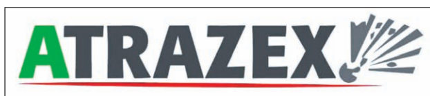
Imagen 4. Logotipo proyecto ATRAZEX.