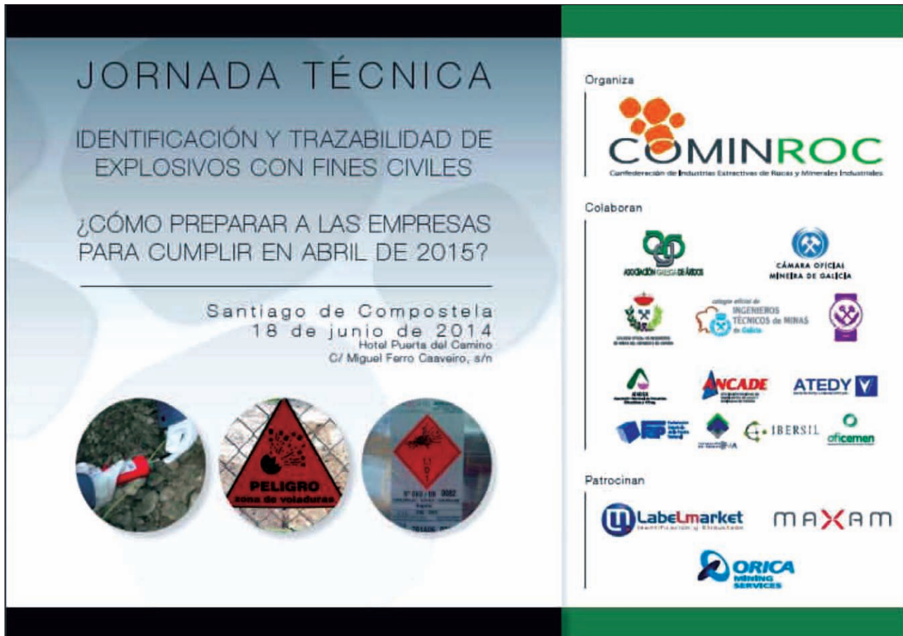
Imagen 3. Jornada Técnica Santiago de Compostela. Junio 2014.

coexistencia entre el sistema actual y el nuevo, obligatorio a partir del 5 de abril de 2015. Tras esta búsqueda, se constataron la existencia de 3 sistemas en el mercado, pero la Asociación consideró oportuno explorar la posibilidad de elaborar un sistema propio, creado y adaptado al sector de los áridos, debido a las deficiencias detectadas en los sistemas existentes, tales como graves faltas de madurez tecnológica en todos ellos (eran adaptaciones de sistemas de otros sectores), escasa implantación en la península (sin distribuidor en España), y un muy elevado coste de implantación (de varios órdenes de magnitud).