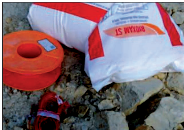
Imagen 8. Elementos de voladura.

Debido a este retraso en la implantación de la directiva por parte de algunos fabricantes y distribuidores, el período de coexistencia