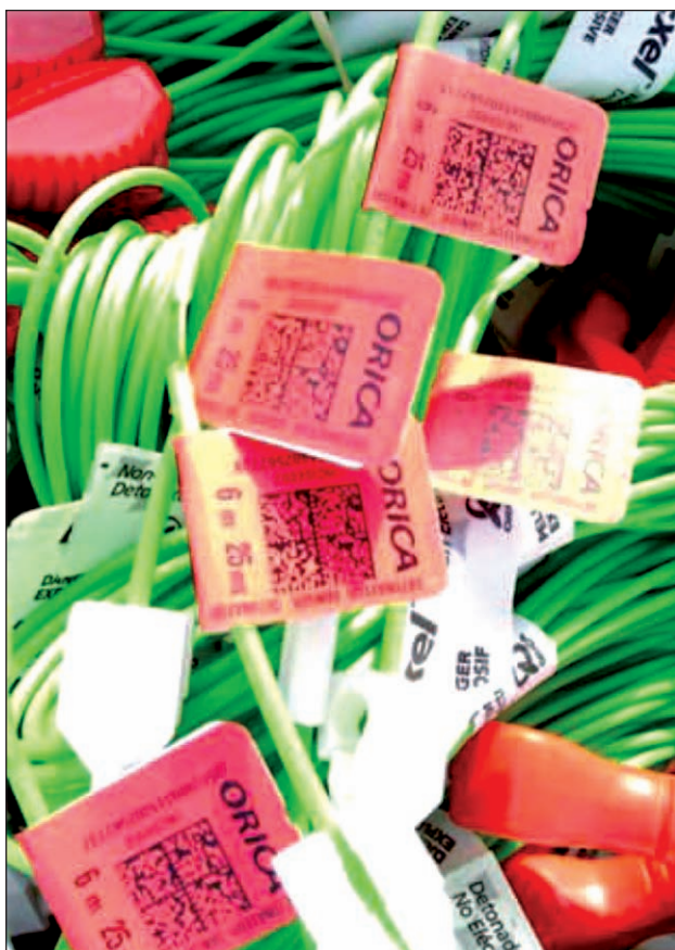
Imagen 1. Conectores.