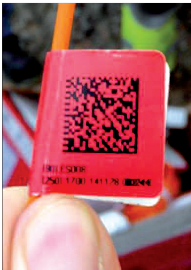
Imagen 2. Código QR.

La responsabilidad del adecuado uso y control de los explosivos recae sobre todos nosotros, Administración, fabricantes, distribuidores y consumidores.