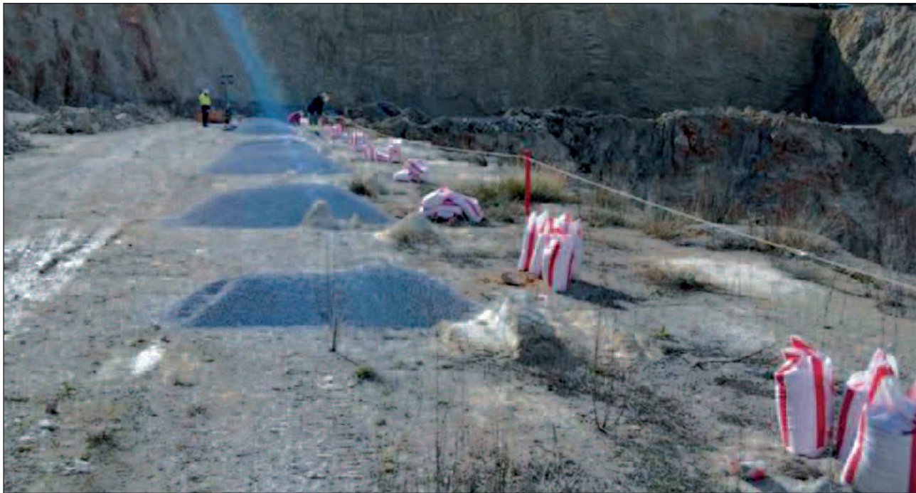
Imagen 7. Reparto de explosivo.

incompletos, incorrectos, posibles devoluciones, deficiencias de marcado en el producto, excedentes de productos, gestión de polvorines, etc... Desde el primer momento se consideró, tanto por parte de los técnicos de la AGA, como de la empresa de desarrollo de software, crucial esta parte del proyecto, motivo por el cual se invirtió tanto tiempo y recursos en ella (Imagen 7).