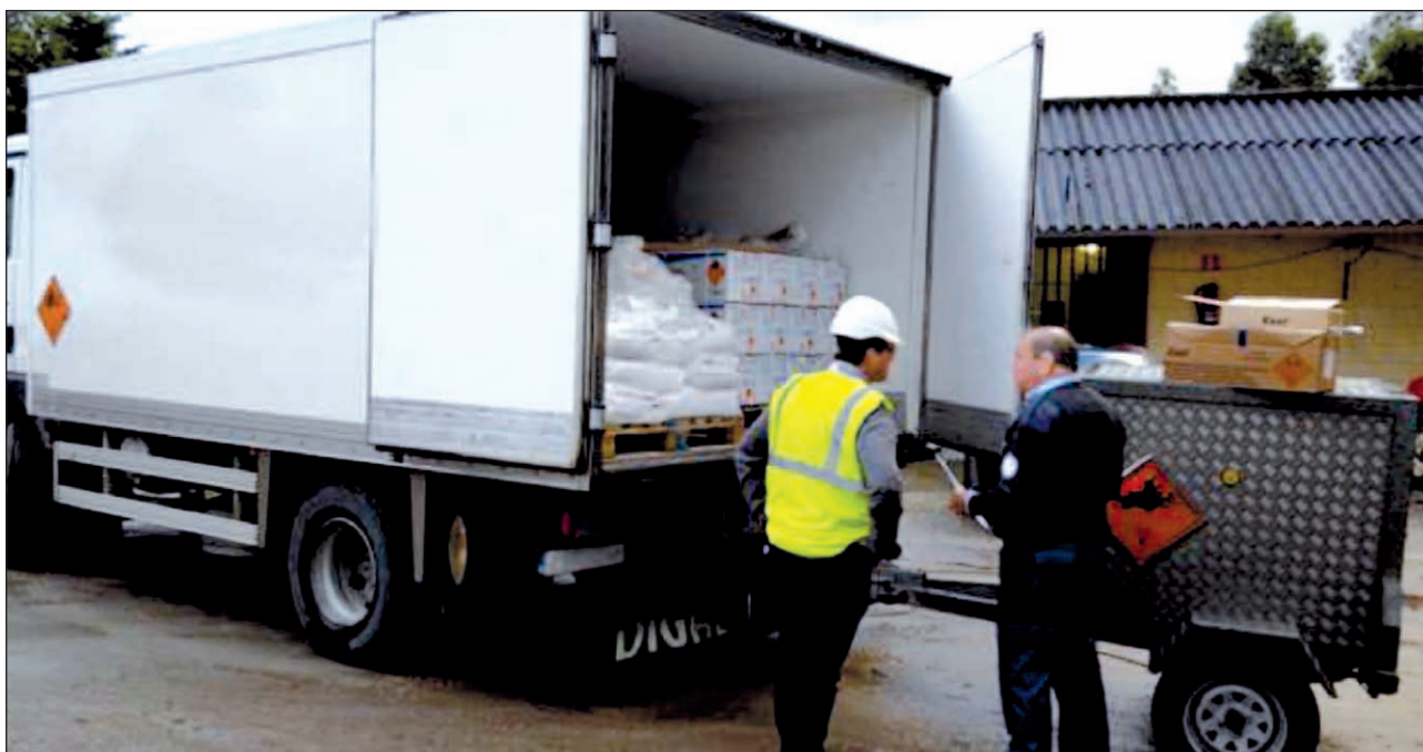
Imagen 5. Recepción de explosivo.

• Empresas de Perforación y voladura: como grandes consumidores de explosivos, intervinieron aportando su experiencia durante el diseño de la aplicación,